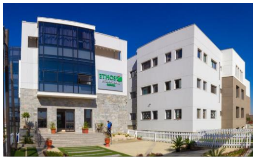
شكل (1): الواجهة الرئيسية لمدرسة إيثوس الدولية

مدرسة إيثوس هى مدرسة دولية خاصة فى مصر، تقدم تعليماً بريطانياً من الدرجة الأولى، أنشئت المدرسة فى يناير 2014م. هذا وتحل المدرسة مساحة 2.5 فدان من أراضى مدينة الشيخ زايد، وتقع فى مجمع تعليمى صديق للبيئة، ويتميز الموقع بسمات خضراء وصديقة للبيئة، حيث تم الإنتهاء من المرحلة الأولى وتشغيلها فى عام 2015م، بمساحة 1000متر مربع، والتي تضم 21 فصل دراسى، بدءاً من المرحلة التأسيسية الأولى وحتى الصف السادس 12 .