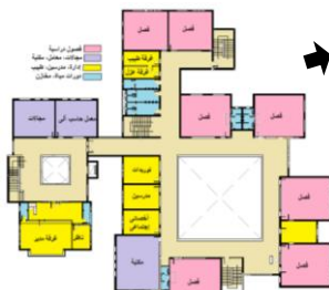
شكل (2): المسقط الأفقى للدور المتكرر لمدرسة إيثوس الدولية